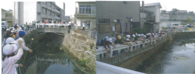
NPO法人と地元小学校生が行うEM団子投入とEM活性液の投入。